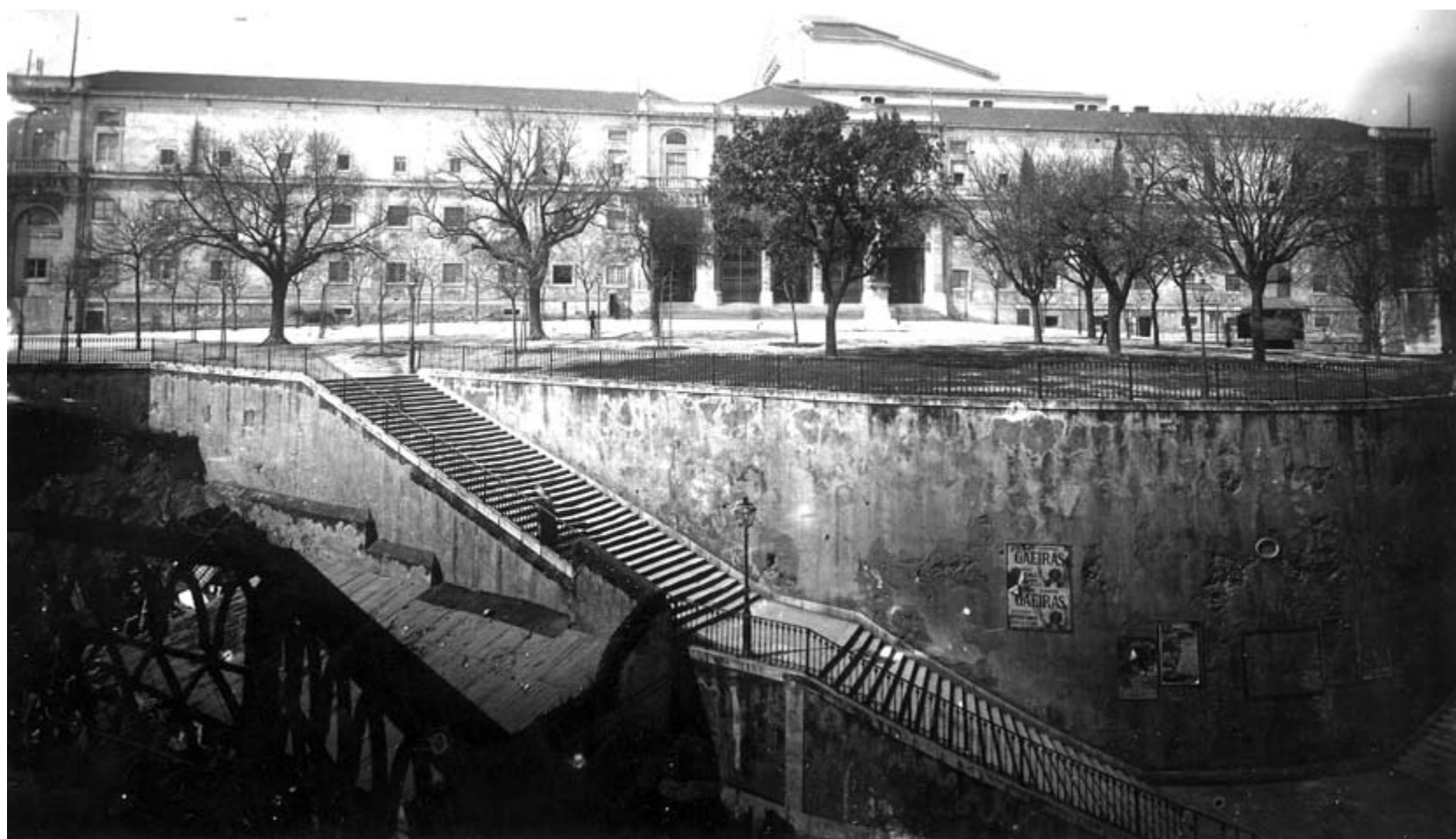
Palácio das Cortes – o edifício que acolheu a Assembleia Nacional Constituinte, c. 1903.

Essa seria uma Nação “composta por todos os seus elementos”, pelo “conjunto de todos nós”, pelo “povo”, tido como equivalente à nação, e por todas as classes. Isso naturalmente excluiria a existência de uma representação política por classes sociais e, tal como Teófilo Braga veementemente defendeu na Assembleia Constituinte, também a necessidade de uma segunda câmara. ■