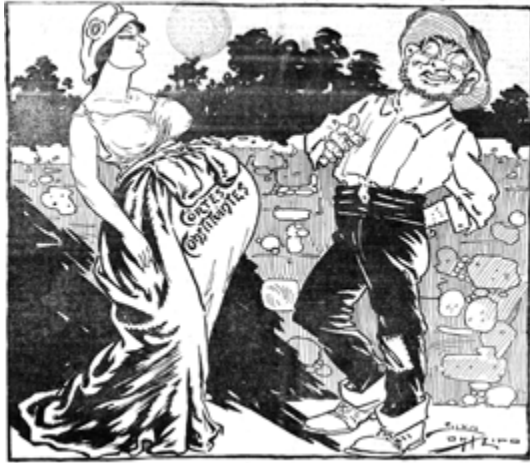
—Este tenho a certeza que é só meu!... Os Ridículos, 14 de Junho de 1911. HML