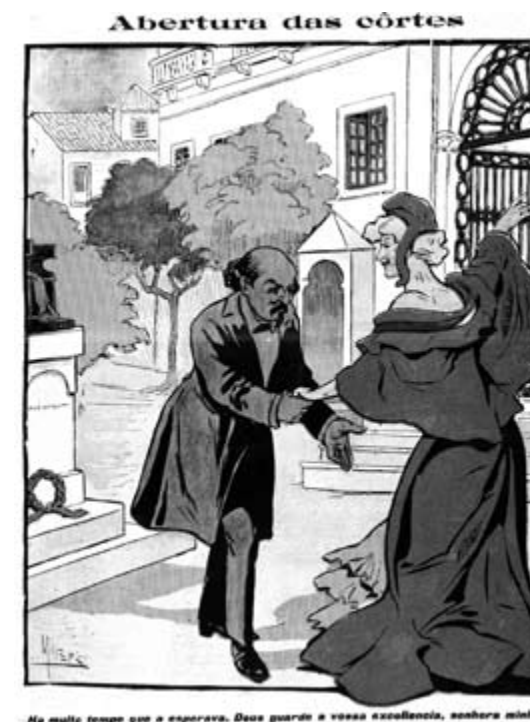
Ma muito tempo que o esperava. Deus guarde a vossa excellencia, senhora minha? -Luzia e fraternidade, cidadã!

Eleitos os deputados, a Assembleia Constituinte deparou-se com as primeiras tarefas de formalização do novo regime. Procedeu-se à proclamação da República e depois à sua aclamação popular por uma multidão que aguardava a presença pública dos deputados para se exprimir.