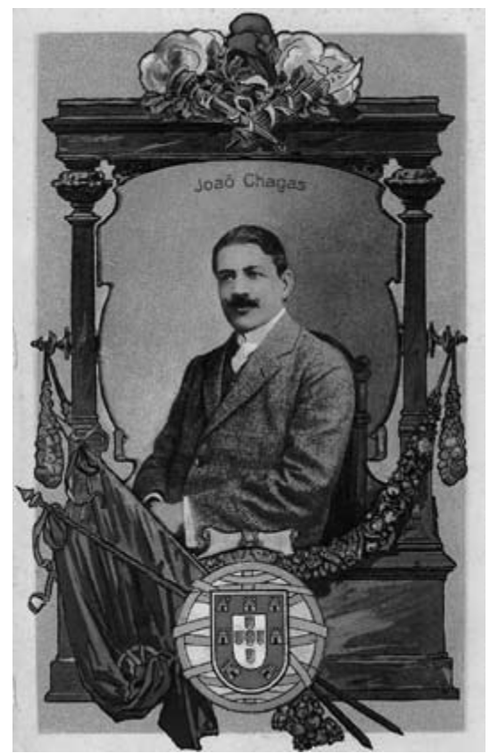
João Chagas, o primeiro Presidente do Ministério após a aprovação da Constituição. Postal. AHP

Deputado José de Castro, sessão n.º 16 de 7 de Julho de 1911. ■