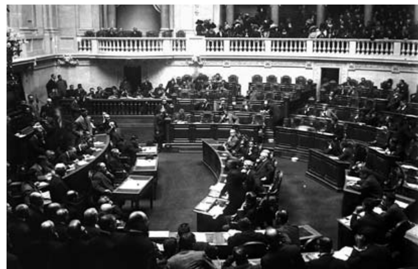
Sessão da Câmara dos Deputados, 16 de Outubro de 1911.