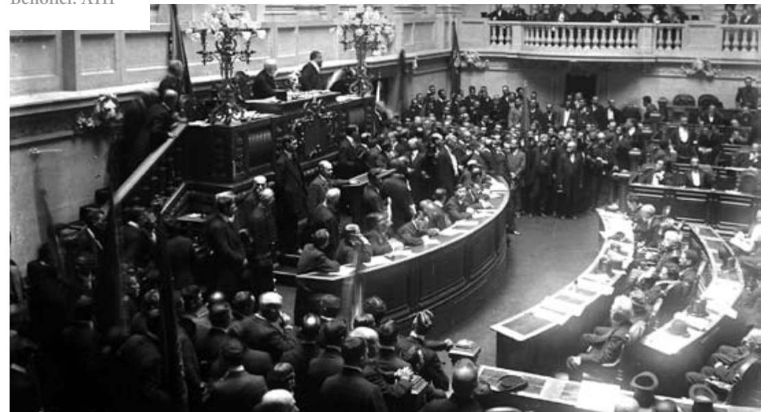
Sessão inaugural da Assembleia Nacional Constituinte, 19 de Junho de 1911.