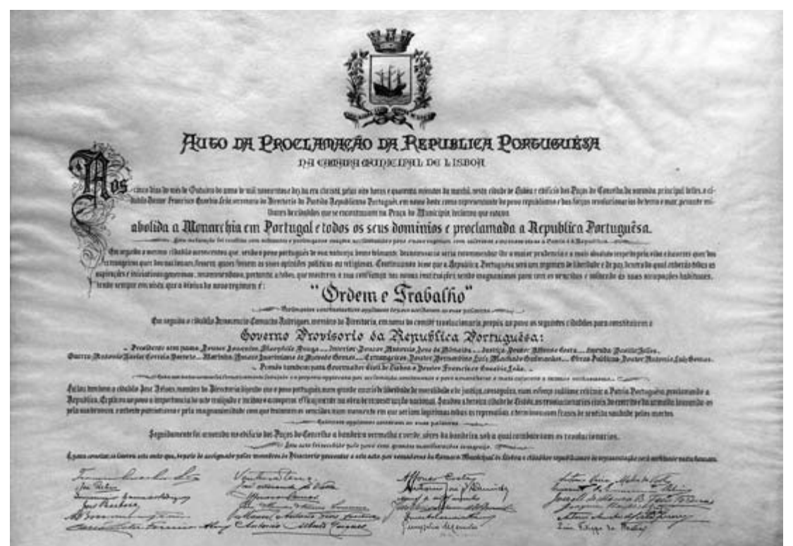
Auto da Proclamação da República Portuguesa. CML