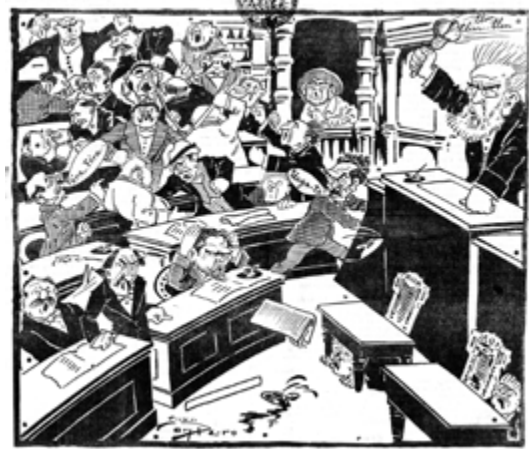
Os Ridículos, 24 de Julho de 1911. HML