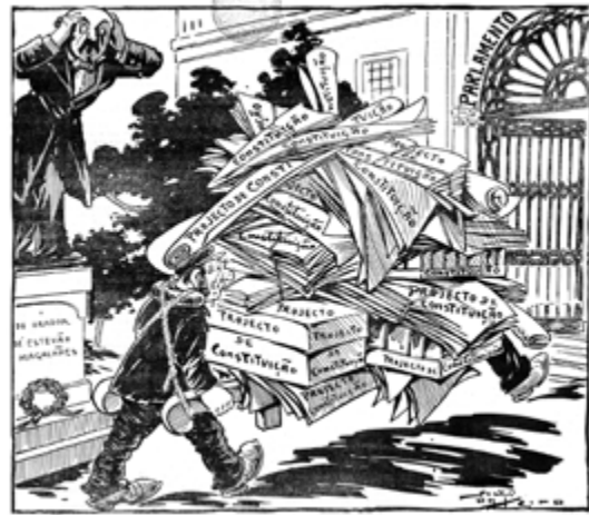
Até o José Estevam está maluco! Os Ridículos, 3 de Junho de 1911. HML