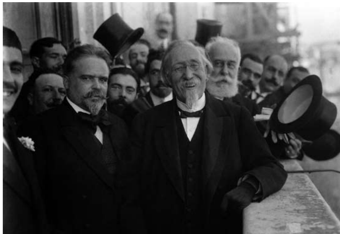
Proclamação do primeiro Presidente da República, Manuel de Arriaga, na varanda do Palácio de S. Bento, após a sua eleição pela Assembleia Nacional Constituinte. 24 de Agosto de 1911.