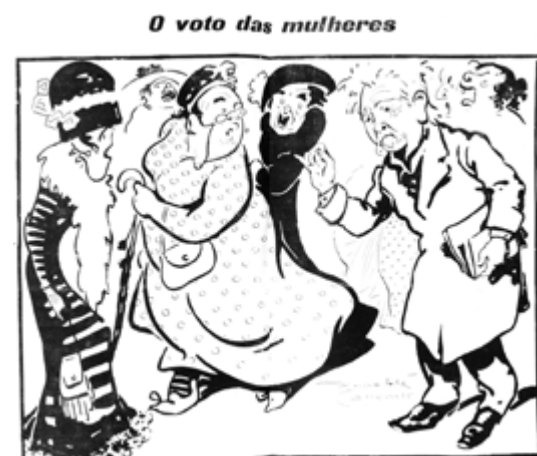
Coro de damas: Queremos votar! Queremos votar! O presidente: Resolveu-se que só votem as damas que tenham mais de 25 anos de idade. O coro: Ah! Isso então não é connosco... O Século - Suplemento Ilustrado, 1911. BMRR

Deputado Jacinto Nunes, sessão n.º 31 de 26 de Julho de 1911. ■