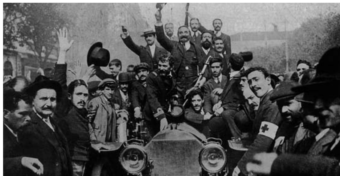
Grupo de revolucionários, 5 de Outubro de 1910. AML-NF

A República foi proclamada por Eusébio Leão, primeiro Governador Civil de Lisboa da nova era, da varanda da sede do município de Lisboa, sendo acompanhado por José Relvas – que proferiu o discurso doutrinário da República – e por Inocêncio Camacho, que anunciou a composição do Governo transitório, liderado por Teófilo Braga, Presidente do Ministério. ■