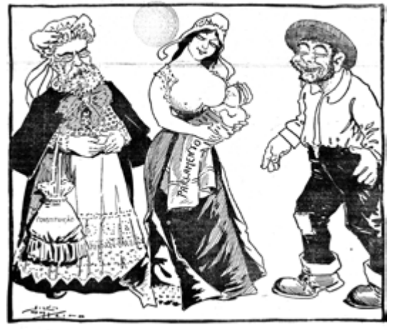
Hei de fazer d'este petiz um grande homem!... Os Ridículos, 21 de Junho de 1911. HML

➤ A simbologia republicana ficou completa com a aprovação dos Hino e Bandeira e com a abolição da Monarquia e banimento da Casa de Bragança.