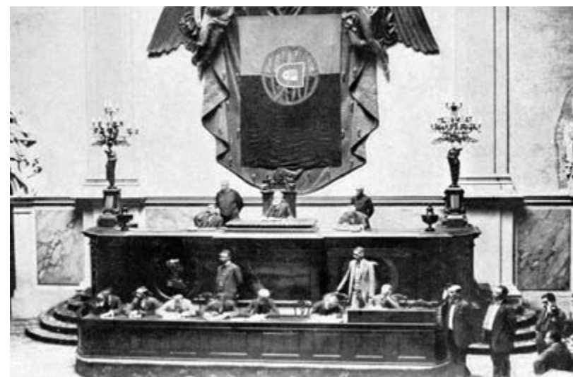
Sessão inaugural da Sala do Senado. Ilustração Portuguesa, n.º 289, 4 de Setembro de 1911.