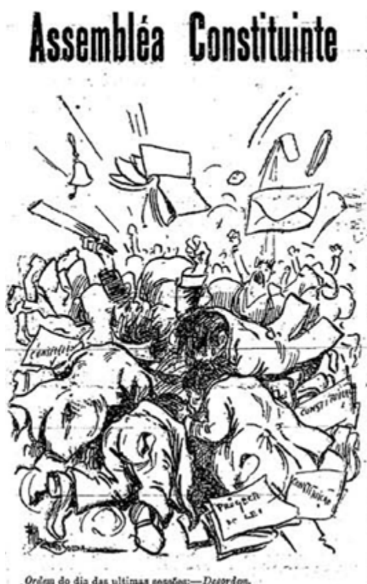
A Capital, 15 de Julho de 1911. HML

Ressaltam dois elementos desta fase do processo constituinte: (i) a urgência na apresentação do texto – factor com o qual alguns membros da comissão justificam óbvias deficiências de carácter técnico – e (ii) a divisão entre os deputados sobre qual o rumo a tomar na construção do novo sistema de governo (se de incidência parlamentar, se de carácter presidencial).