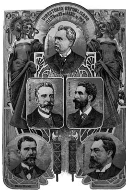
Directório republicano. Postal. AHP

O futuro guardava uma inevitabilidade: o nascimento da Constituição antecederia a dissolução republicana em vários partidos. ■