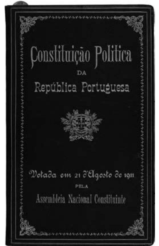
Capa da Constituição da República Portuguesa de 1911. AHP

Naturalmente, um lugar de relevo ocupam os próprios trabalhos constituintes, mas pretende-se mostrá-los situados no ambiente circundante do País e da Europa do tempo, com os vários circunstancialismos em que decorreram, com as suas repercussões internas e externas, com os reflexos na e da opinião pública, com o tratamento jornalístico que receberam; em suma, numa perspectiva histórica que vai muito para além do simples texto constitucional. ■